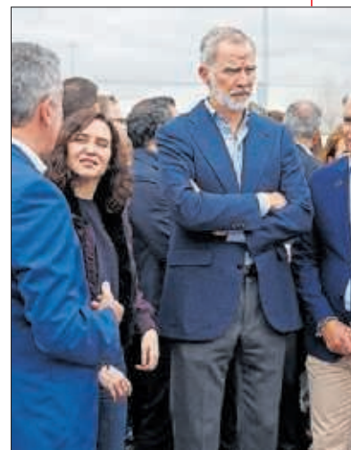
Ayuso, junto al Rey Felipe VI.

aquí a la FE es alucinante, no tengo palabras”. Y esto es solo el principio de una vida dedicada a las carreras...: “Me gustaría seguir formándome en Inglaterra. Mi sueño es llegar a la F1 como ingeniera de pista de algún equipo”. Va por buen camino.