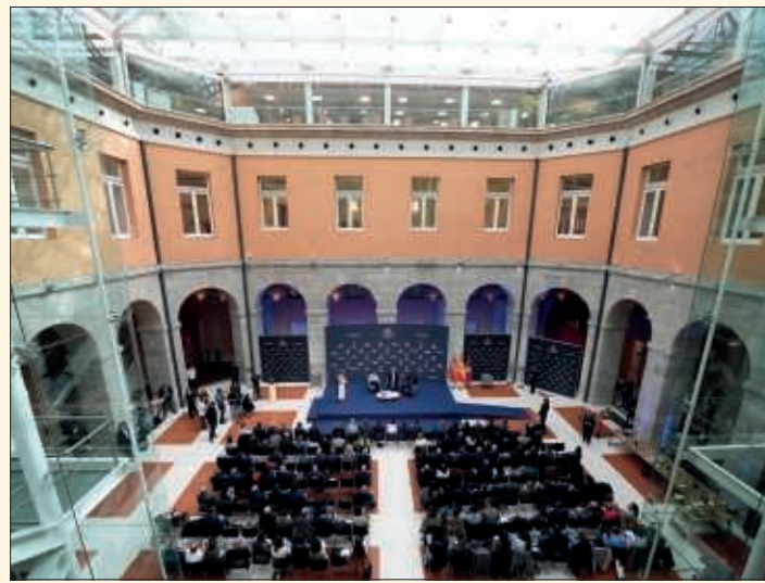
Acto de presentación de los nominados a los Premios Laureus 2026.

Comaneci, Boris Becker, Cafú, Ruud Gullit, Giacomo Agostini o Luis Figo, algunos de los miembros de la Academia que deciden a los ganadores finales, nominados a través de los votos de prensa de todo el mundo. También acudirá al evento Isabel Díaz Ayuso, presidenta de la Comunidad de Madrid, en un día para el recuerdo.