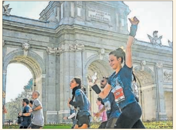
El Movistar Medio Maratón, a su paso por la Puerta de Alcalá.