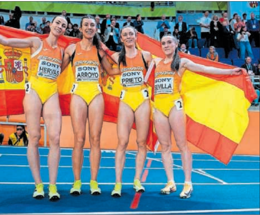
Las 'Golden Bubbles' posan con banderas de España.