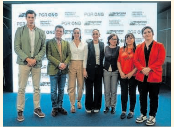
Presentación del proyecto Deporte y Valores en la Cañada Real.