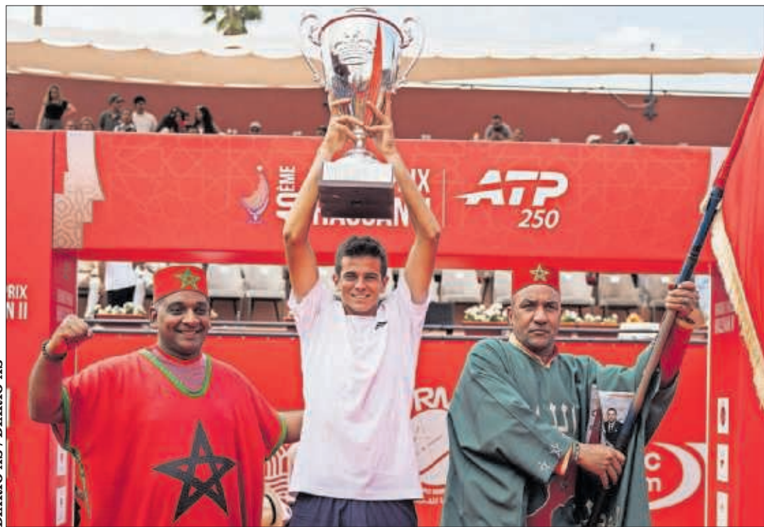
Rafa Jódar levanta el trofeo de campeón en el ATP 250 de Marrakech.

Diario as | viernes, 10 de abril de 2026