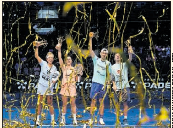
Los campeones de la pasada edición del Premier Padel de Madrid.

de Valladolid, torneo al aire libre que se disputa en la icónica Plaza Mayor, uno de los mejor organizados y con las respuestas más rápidas para solucionar contingencias, también ha abierto las taquillas, aunque en la ciudad castellana no necesitan tanto tiempo porque su aforo es casi la mitad que en Madrid.