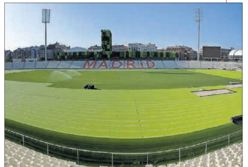
El Estadio de Vallehermoso de Madrid.

Propuestas Se tendrán en cuenta el nivel de la competición o los resultados