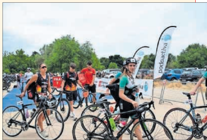
La madrileña Casa de Campo, llena de triatletas.

Campo de Madrid. El programa competitivo incluye distancias para todo tipo de deportistas; SuperSprint y Triatlón de la Mujer (350 metros nadando, 7,7 kilómetros pedaleando y 2 kilómetros de carrera a pie), Sprint (750m - 20km - 5km) y Estándar (1500m - 40km -10km), y se podrá participar de forma individual o por relevos.