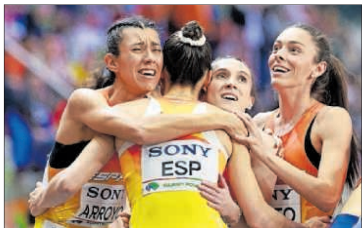
El equipo español de 4x400 se funde en un abrazo.