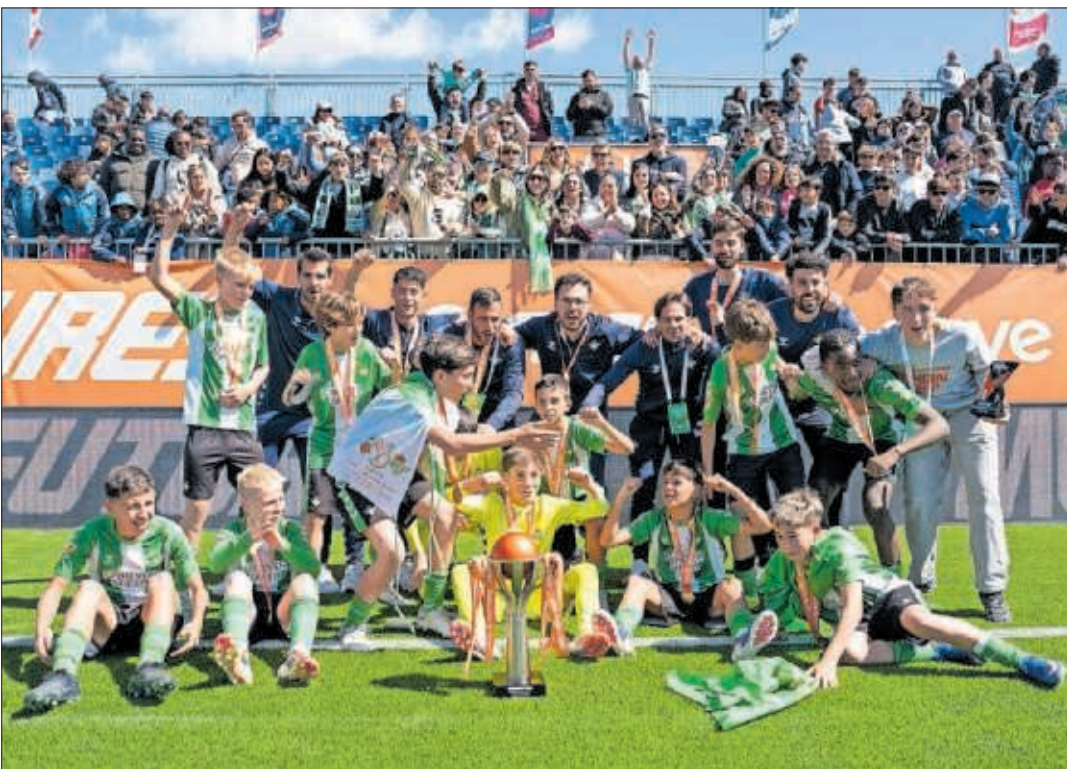
PABLO MORENO / LALIGA