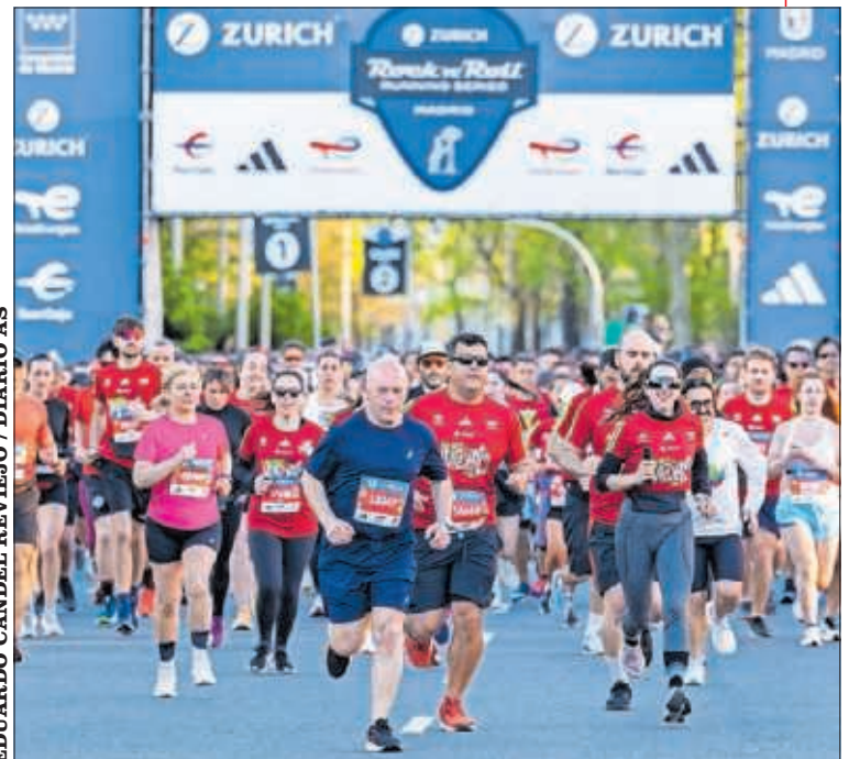
Salida de la pasada edición de la Zurich Rock 'n' Roll.

El año pasado, la Zurich Rock 'n' Roll Running Series Madrid dejó un impacto económico de más de 70 millones de euros en la capital, y este año se prevé que vuelvan a batirse cifras récord. La cuenta atrás ya está activada para uno de los eventos más multitudinarios del año en Madrid.