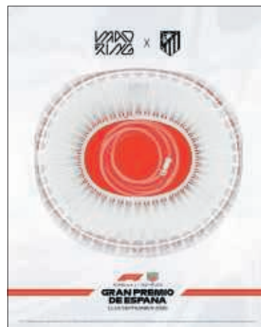
Cartel promocional del GP de F1.

► ¿NFL? Uno de los grandes momentos en la región del año pasado se vivió en