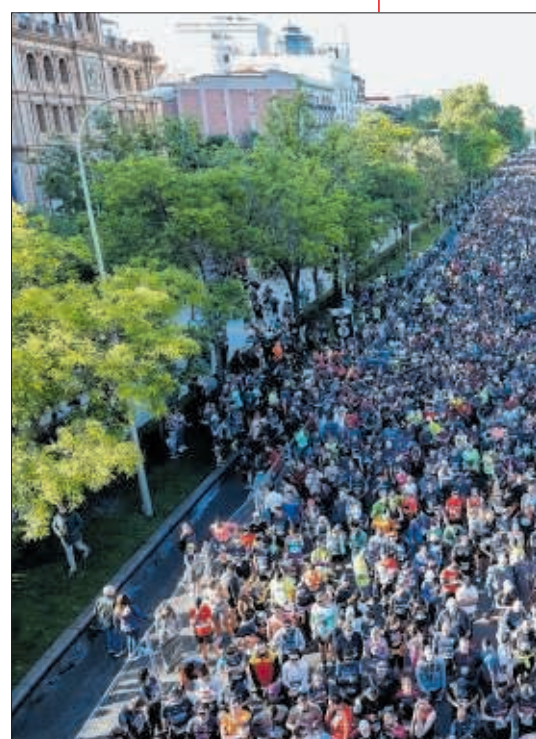
Corredores de la maratón.