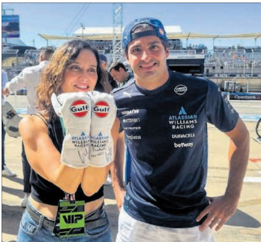
Isabel Díaz Ayuso posa con Carlos Sainz en una carrera de la pasada temporada.

“Madrid se consolida como una región del deporte. Tenemos un compromiso para realizar grandes proyectos, los mejores eventos, y no entorpecerlos nunca desde las administraciones. Lo que hay aquí supone casi la cuarta parte de la industria deportiva del país. Madrid está viviendo sus mejores momentos y tiene sus mejores años por delante”, explicó hace dos meses la