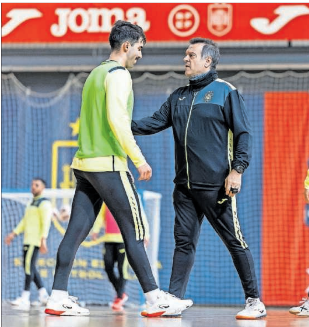
Jesús Velasco da órdenes a Gordillo en un entrenamiento de la Selección española en Las Rozas.

Una concentración, para terminar de ajustar sistemas y adquirir automatismos de juego, que durará nueve días, momento en el que la Selección volará hacia Liubliana (Eslovenia) con la intención de no moverse hasta la ansiada final. Antes habrá que superar el duro debut, además de los teóricos trámites en fase de grupos ante Bielorrusia y Bélgica,