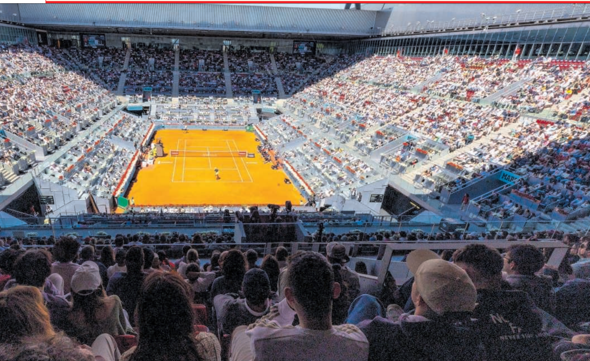
El Estadio Manolo Santana de la Caja Mágica, durante un partido de la última edición del Madrid Open.