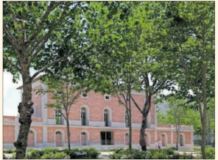
Imagen renderizada del proyecto Milla Canal.

acometer las obras del nuevo acceso al complejo y la restauración de la fachada sur del antiguo primer depósito. Igualmente, en este ejercicio se ampliarán los vestuarios y se mejorará la accesibilidad de los campos de fútbol, así como se redactará el proyecto para las obras de reforma general de las instalaciones.