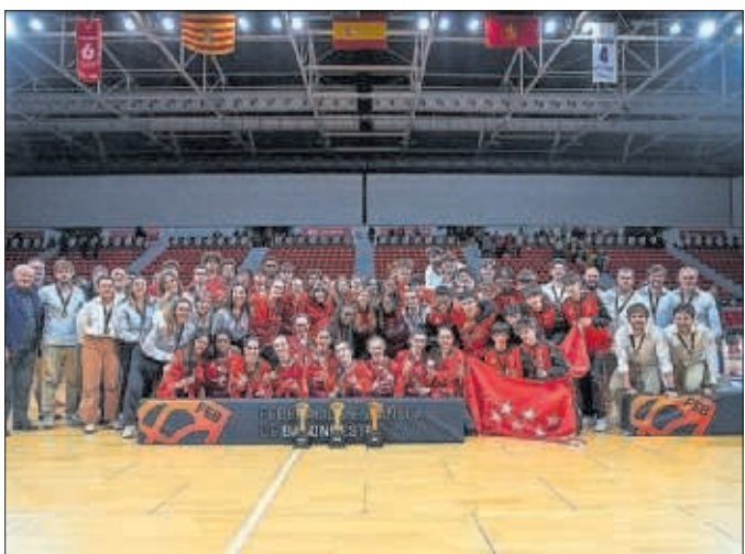
Los equipos madrileños posan con los trofeos logrados.

Líderes Ninguna otra comunidad autónoma logró dos oros en los Nacionales