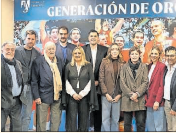
Los asistentes al homenaje en Torreldones, en una foto de familia.