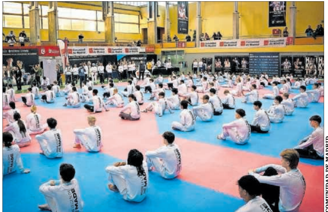
Los asistentes al encuentro en San Sebastián de los Reyes, sentados a la espera de un ejercicio.