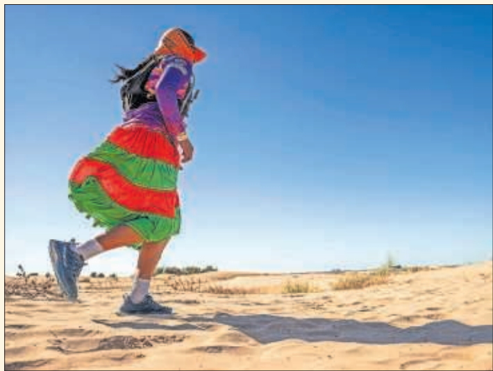
Una rarámuri, durante una carrera en las dunas.