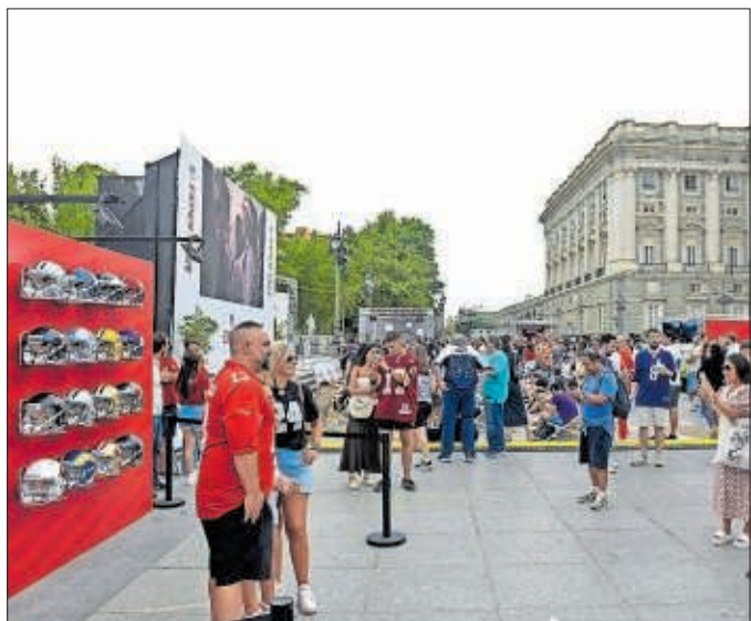
Aficionados de la NFL disfrutan de la Watch Party de Madrid.

No en vano, además de la capital española, solo otras seis ciudades en el mundo han acogido un evento de estas características: Río de Janeiro (Brasil), Brisbane (Australia), Mánchester (Inglaterra), Berlín (Alemania), Ciudad de México (México) y Toronto (Canadá).