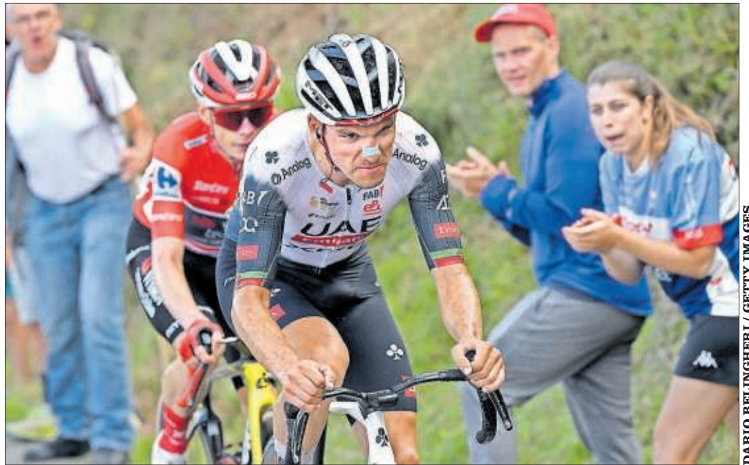
Almeida y Vingegaard, en la ascensión al Angliru durante la presente Vuelta a España.

Hasta que la Conference regrese al barrio el jueves 2 de octubre ante el Shkendija y tras este parón de selecciones, volverá la Liga. Ya asoman dos nuevas citas en el feudo franjirrojo: el partido contra el Celta (21-S, 14:00) y el Sevilla (28-S, 14:00). Hay ganas de Rayo. Ganas de Vallecas.