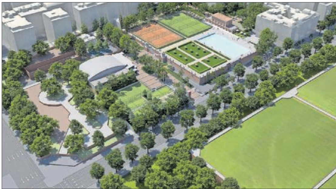
Imágenes renderizadas del aspecto que tendrá el Canal de Isabel II tras las obras.