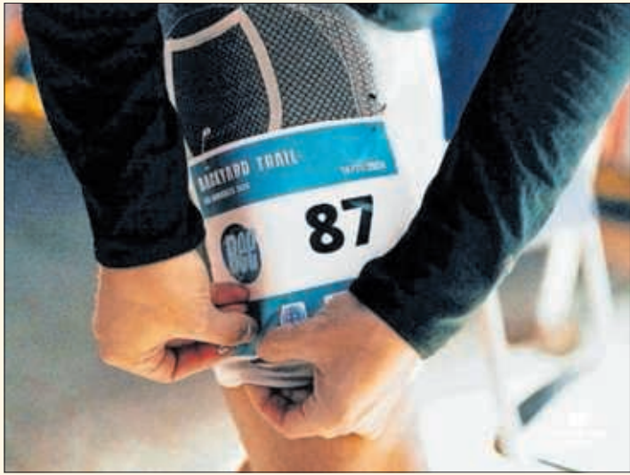
Dorsal de una edición previa de la Bee Backyard Trail.