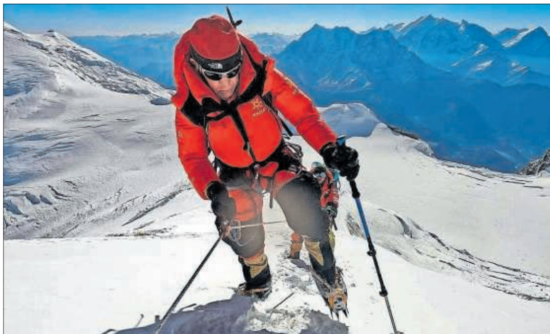
Carlos Soria, en una de sus expediciones por la cordillera del Himalaya.