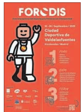
Cartel del Foro.

La Ciudad Deportiva Valde lasfuentes de Alcobendas, Ciudad Europea del Deporte 2025, acogerá una cita inolvidable del 16 al 20 de septiembre: el I Foro Internacional del Deporte para personas con Discapacidad (FORODIS), organizado por la Asociación Enrique Esteire Perla In Memoriam, en colaboración con el Comité Paralímpico Español (CPE) y el Ayuntamiento de Alcobendas. El noble propósito no es otro que el de consolidar el compromiso con la inclusión, la innovación y la visibilidad del deporte para personas con discapacidad. Se trata de un foro pionero en su sector, ya que será el primero de carácter internacional celebrado en España, y contará con el privilegio de reunir a expertos en la materia, deportistas, instituciones y empresas líderes en tecnología y accesibilidad de todo el mundo para debatir y compartir avances en este ámbito. El programa incluye la participación de destacados deportistas paralímpicos de renombre, como son el campeón paralímpico en ciclismo contrarreloj de la categoría H2 Sergio Garrote, la triatleta Eva Moral, y el número uno del tenis en silla de ruedas en España, Martín de la Puente.