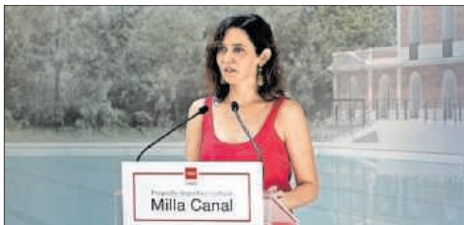
Isabel Díaz Ayuso, durante su intervención en Milla Canal.