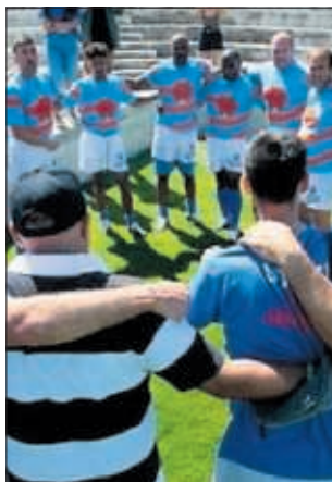
Un corro durante un partido.

Un evento muy especial y emotivo, especialmente por la presencia de liberados que formaron parte de la primera escuela de rugby creada en un centro penitenciario, allá por noviembre de 2011 en la prisión de Estremera (Madrid). Varios de esos exinternos, ya en libertad, participaron en el torneo en el combinado Invictus I. La cita contó con equipos de seis centros: Zuera – Zaragoza (Club de Rugby Fenix), Valladolid (Cáritas Valladolid y Club Rugby El Salvador), Estremera Madrid VII (Fundación Invictus), Madrid II. Alcalá Meco (Fundación Rugby Cisneros), Madrid I- Alcalá Meco mujeres (Club de Rugby Alcalá) y Villabona en Asturias (Federación de Rugby del Principado de Asturias).