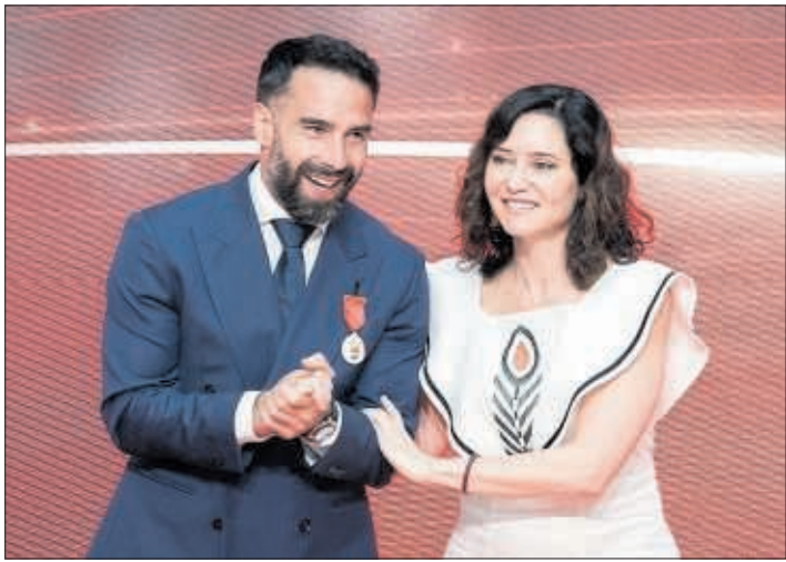
Dani Carvajal, con la Medalla de Oro e Isabel Díaz Ayuso.

Por otro lado, el pasado miércoles, la Comunidad de Madrid participó en la clausura del CXO Madrid Summit CrowdStrike Mercedes-AMG Petronas F1, que sirvió para reforzar la colaboración entre la Consejería de Digitalización y CrowdStrike, empresa líder en ciberseguridad y socio clave de Mercedes en Fórmula 1.