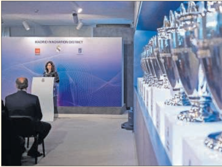
La presentación del Madrid Innovation District, en Valdebebas.