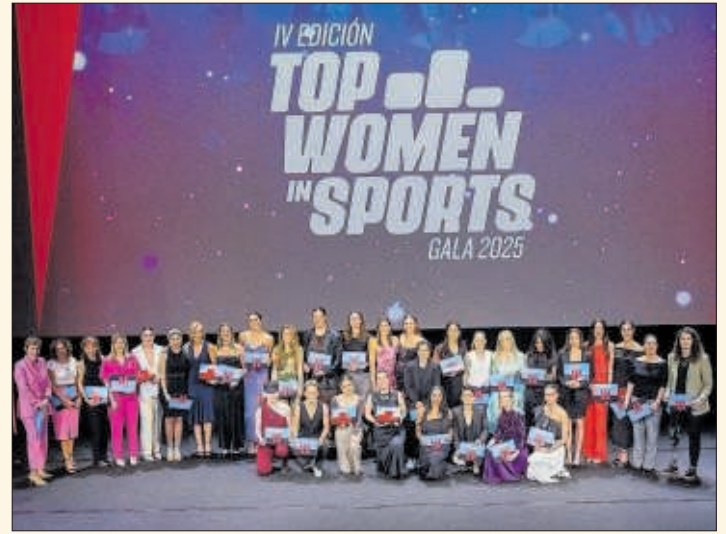
Foto de familia de la cuarta gala Top Women in Sports, en Madrid.