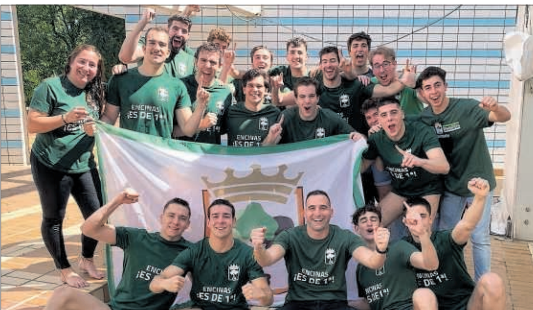
Los jugadores del Encinas de Boadilla celebran su último ascenso, el año pasado a Primera División.

En casa El Encinas debe remontar mañana un 8-7 al Sant Feliu