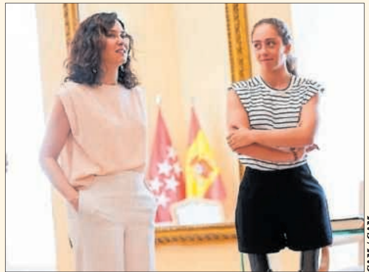
Isabel Díaz Ayuso recibe a la multimedallista Audrey Pascual.

embajadora de Madrid, nació con agenesia bilateral de tibias y le fueron amputados ambos pies a los nueve años. Reconocida por su espíritu de superación, disciplina y versatilidad, a los seis ya nadaba, a los 11 disputó su primera prueba de esquí, a los 16 ya formaba parte del equipo Fundación y a los 23 entró en el equipo nacional.