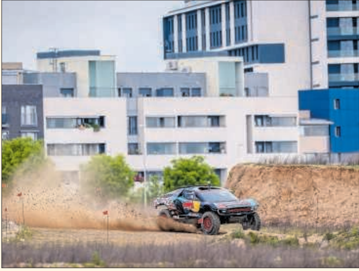
El Ford Raptor de Carlos Sainz, en el circuito, todavía en obras.