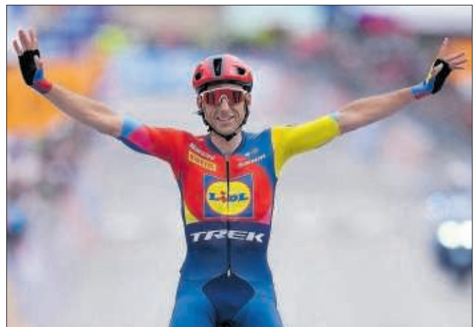
Carlos Verona celebra su victoria en la 15ª etapa del Giro.