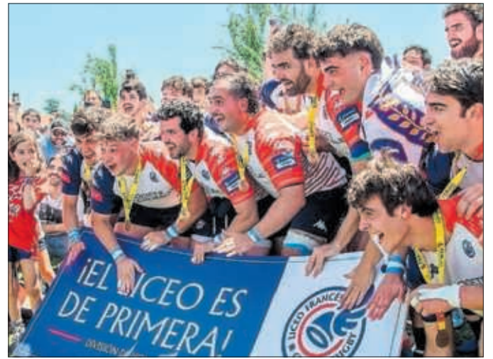
Los jugadores del Liceo Francés celebran el ascenso.