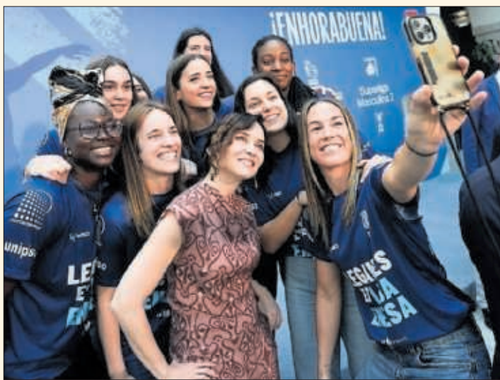
Isabel Díaz Ayuso, en el acto celebrado en la Real Casa de Postas.