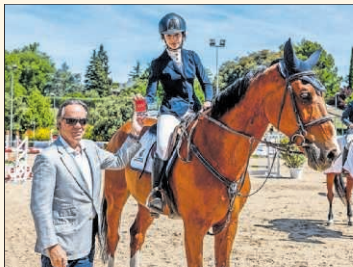
Una amazona, en la Copa Comunidad de Madrid de saltos.