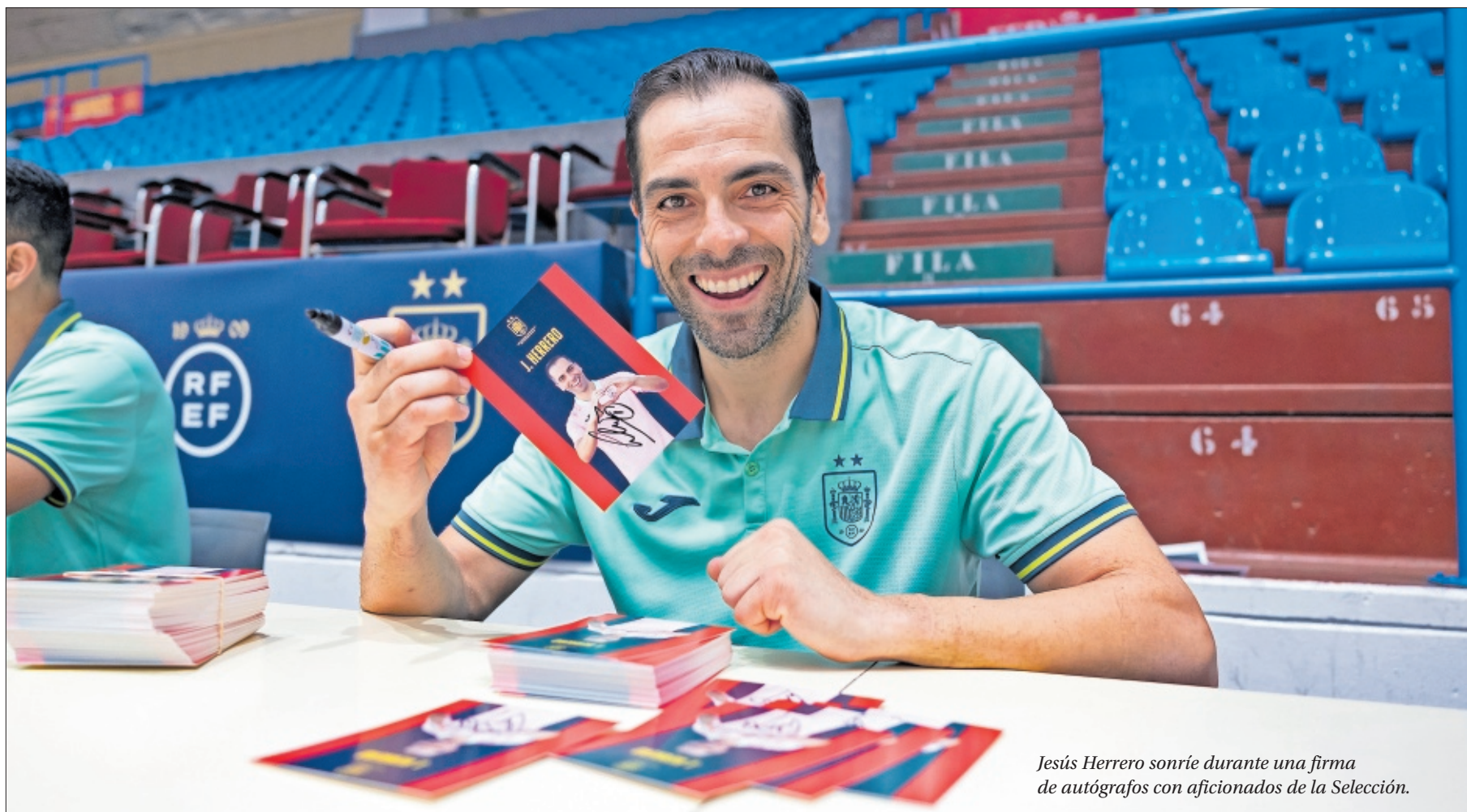
Jesús Herrero sonríe durante una firma de autógrafos con aficionados de la Selección.