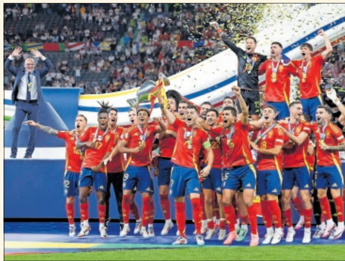
La Selección española de fútbol levanta la Eurocopa de 2024.

perfección la juventud y veteranía de sus jugadores con el talento y entrega. Durante la Eurocopa 2024, ha ganado todos sus partidos desplegando un gran nivel y juego. La Selección suma su nombre al palmarés de un galardón que han recibido figuras como Rafael Nadal (2008), Pau Gasol (2009) o Fernando Alonso (2011).