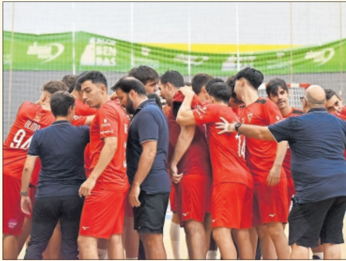
La plantilla del Alcobendas hace una piña.