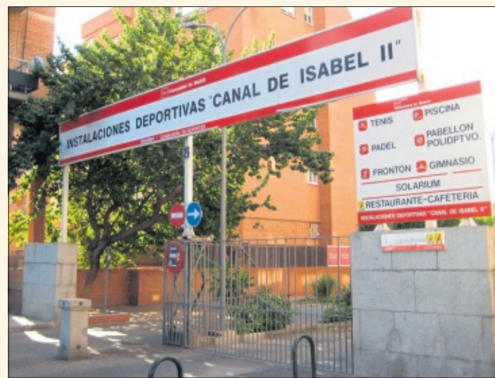
Entrada a las instalaciones deportivas del Canal de Isabel II.

La reforma integral, prevé, igualmente, la construcción de otra pista de pádel, que se sumará a las cuatro existentes; la mejora de la superficie destinada a la práctica de tenis de mesa y la renovación total de las siete pistas de tenis. En el caso de las de tierra batida, se cambiará su pavimento y el sistema de drenaje.