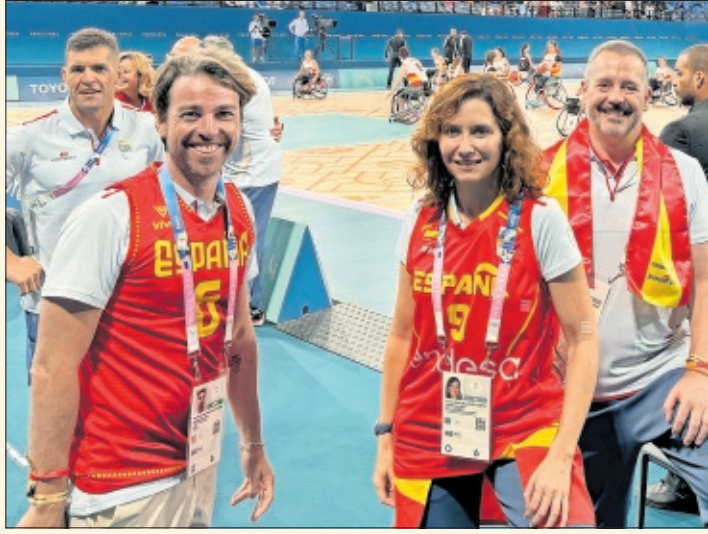
Díaz Ayuso y De Paco Serrano, en el Arena Bercy de París.