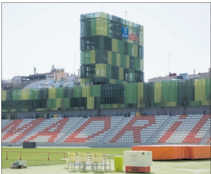
Estadio de Vallehermoso en Madrid.

Además, deberán cumplir, al menos, uno de los siguientes requisitos: haber participado en campeonatos europeos o mundiales, ser medallistas de ámbito nacional o estar entre los tres primeros del ranking español oficial publicado por la Federación correspondiente en el momento.