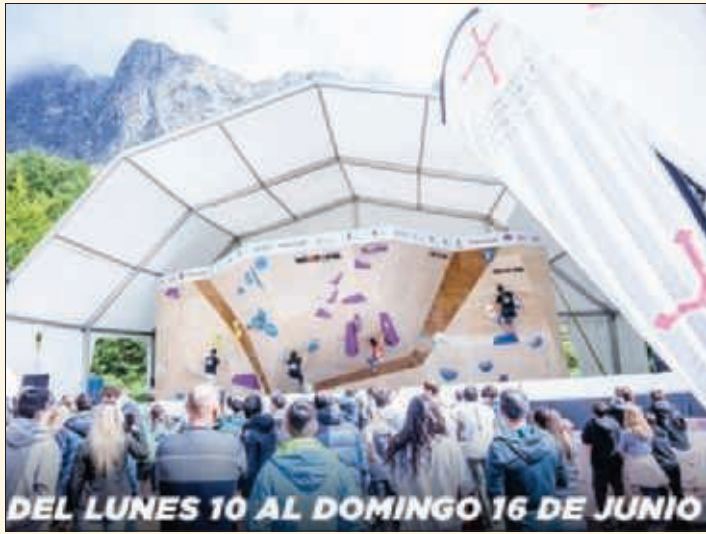
Cartel promocional de Climbing Madrid.