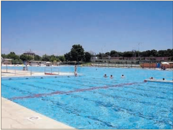
Piscina de Madrid durante el verano pasado.