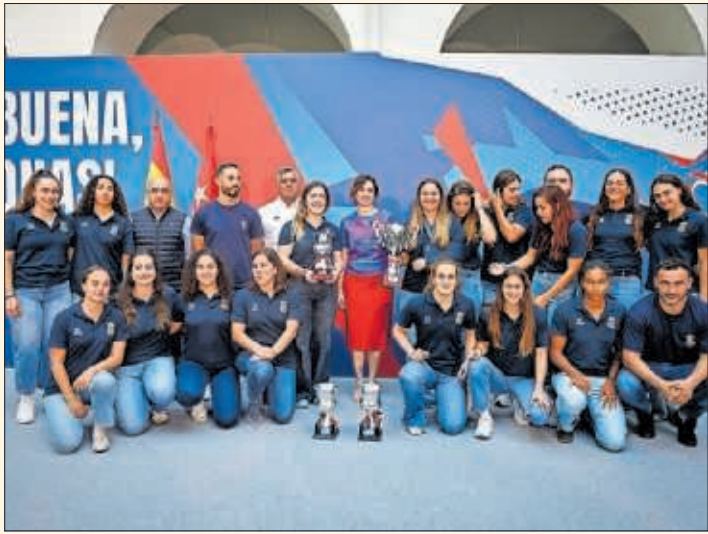
Isabel Díaz Ayuso, con las jugadoras del Silicius Majadahonda.