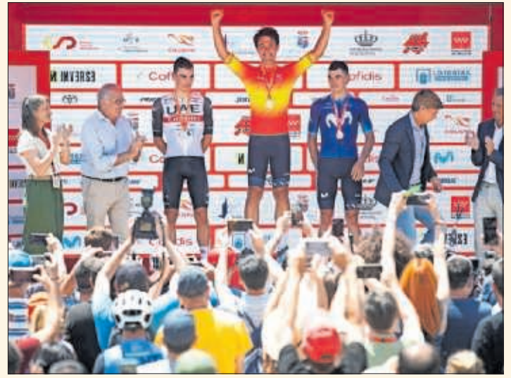
Podio del Campeonato de España Élite del año pasado.

individuales Élite UCI-Élite masculina, y Élite-sub-23 femenina y sub-23 masculina. El sábado 22 se celebrarán las pruebas en línea Élite-sub-23 femenina y masculina. Finalmente, el domingo 23 de junio, cierra el campeonato la prueba en línea Élite UCI-Élite masculina, con 201 kilómetros y más de 3.300 metros de desnivel.