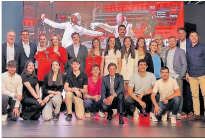
Homenaje a la esgrima madrileña en el WiZink Center.