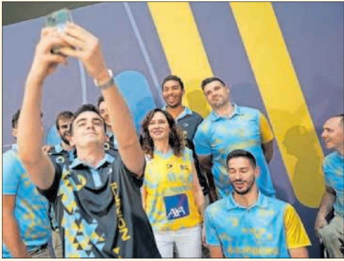
Isabel Díaz Ayuso se hace un selfie con integrantes del CD Ilunion.