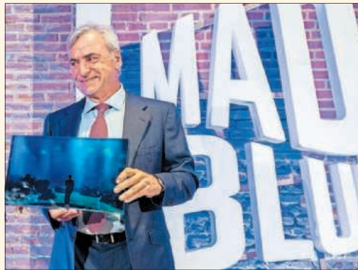
Carlos Sainz sonríe con el premio recibido de MadBlue.

nuestros mejores pilotos, emblema del esfuerzo y los valores deportivos", ha manifestado De Paco Serrano sobre el piloto madrileño. "Todos los premios son un pequeño o gran homenaje que alguien ha decidido darte y que alguien ha decidido que te mereces recibir", explicó a AS el propio Carlos Sainz en la gala.