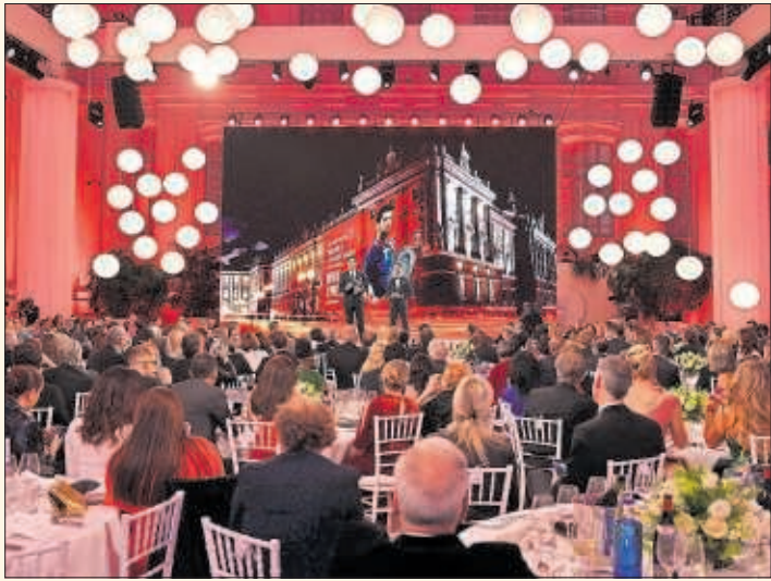
Momento de la gala de los Premios Laureus celebrada en Cibeles.