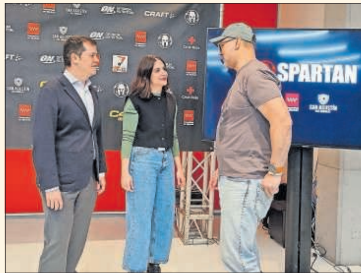
Presentación previa a la Spartan Madrid 2024.

largo del año en más de 50 países y están abiertas a atletas de todos los niveles y capacidades. Fundada en 2005 por el legendario corredor Joe De Sena, es un acontecimiento deportivo que actúa como instrumento de promoción turística y económica de las localidades donde se celebra, y en Madrid celebró su 10ª edición.