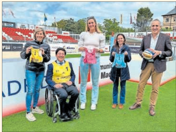
Acto de presentación del VW Beach Pro Tour en Puerta de Hierro.