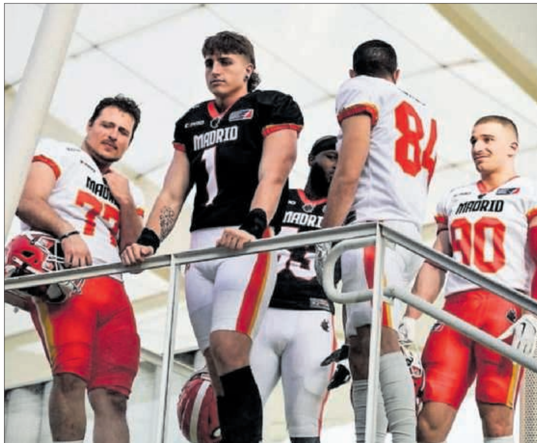
Los jugadores de los Madrid Bravos, en la presentación de las equipaciones en Vallehermoso.