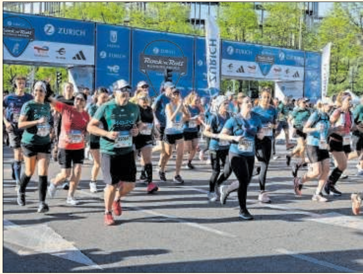
Participantes corren durante la última edición de la carrera.