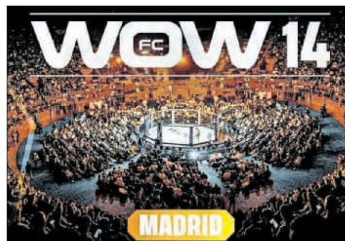
Cartel promocional de WOW 14 en Vistalegre.