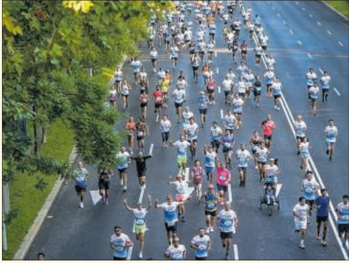
Participantes de 'Madrid corre por Madrid', durante la carrera.