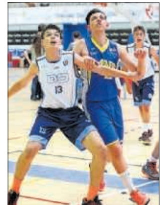
Partido de baloncesto.