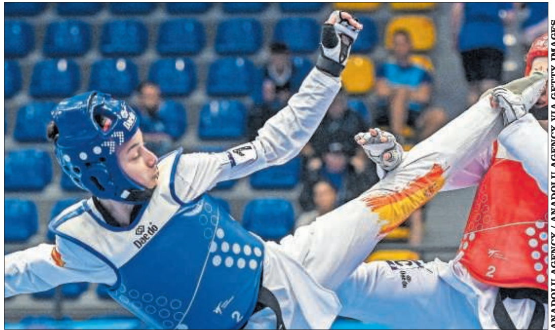
Adriana Cerezo, oro en los Juegos Europeos, golpea a una rival en la cara con su pierna izquierda.