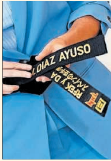
Cinturón entregado a Díaz Ayuso.

la labor de apoyo, difusión y promoción de este deporte llevada a cabo por el Gobierno regional. "La recibimos como un acicate para seguir trabajando sin bajar la guardia, por todos los ciudadanos de Madrid", destacó la presidenta. La región cuenta con más de 17.000 licencias de kárate concedidas (el 23% de las nacionales) y 305 clubes.