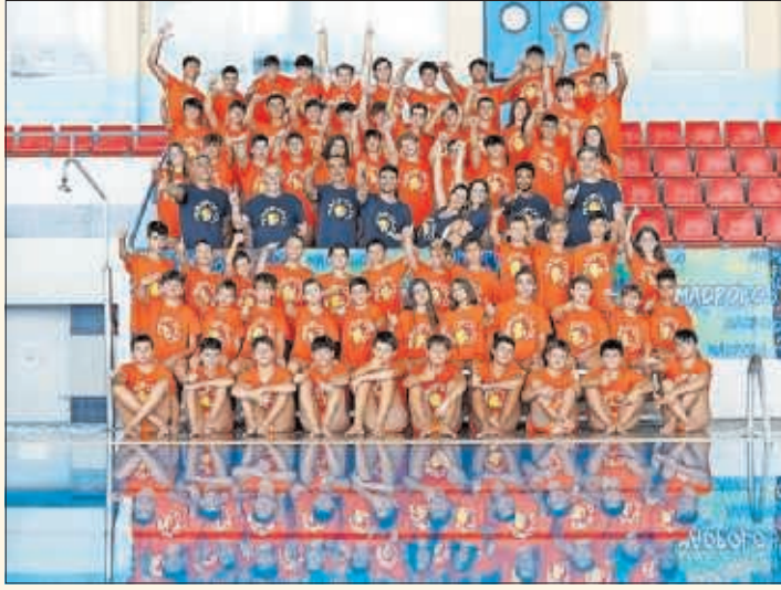
Los participantes del último MadPolo Campus saludan.