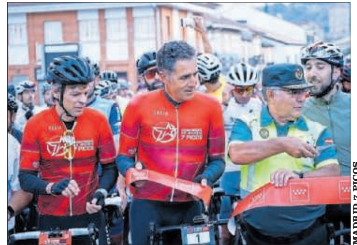
Miguel Indurain, en el corte de cinta de la Madrid 7 Picos.

El más conocido del perfil es la Cruz Verde , pero en cuanto a exigencia son muy similares. Lo que da la dureza es el encadenado continuo de sube y baja. Alguien que en la general esté más alejado se puede meter en una fuga o incordiar desde lejos, esos pueden entrar en un grupo grande y generar problemas. Pero el Jumbo , con el equipo que tiene... Aunque llueva, haga sol o granice, la carrera está entre los tres del Jumbo. Sólo queda por saber el orden. Alguno de los tres se puede filtrar en una fuga grande, de 15 o 20 corredores. Y eso les puede dar la victoria a alguno de ellos. Jumbo tiene claro que quiere los tres primeros en el podio de Madrid.