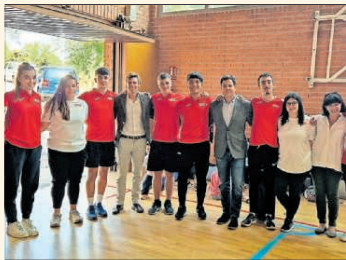
Inauguración del programa Todos Comunidad Escolar.

diferentes disciplinas, como atletismo, bochas, judo, karate, piragüismo y balonmano, con el objetivo de visibilizar y normalizar su práctica entre este colectivo y poner de manifiesto las diferentes opciones para llevarlas a cabo. También contribuye a la captación de deportistas y al desarrollo de competiciones adaptadas.