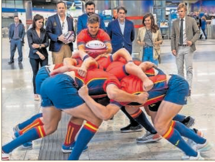
Los jugadores realizan una melé en el Metro de Madrid.