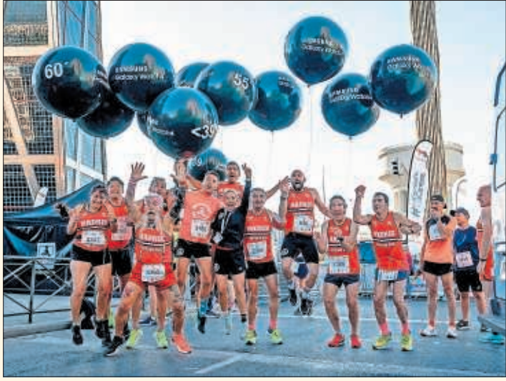
Participantes de la pasada edición de Madrid Vintage Run.