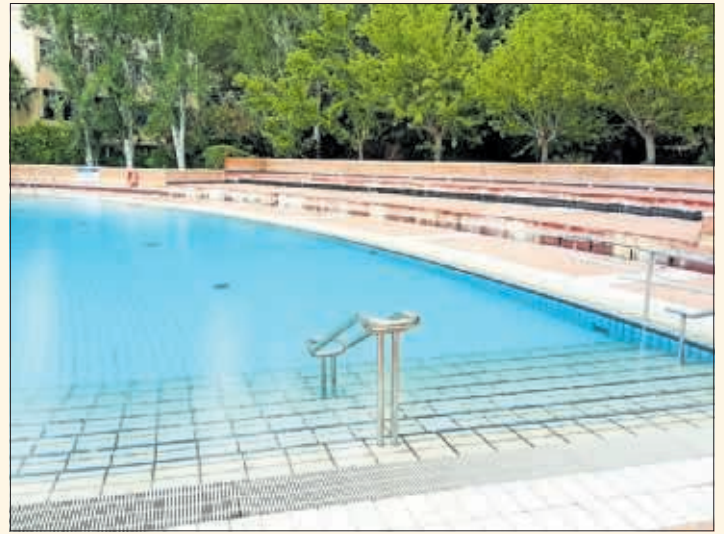
Una de las piscinas madrileñas que abrirá este fin de semana.

del Canal de Isabel II, San Vicente de Paúl, Parque Deportivo Puerta de Hierro y Centro de Natación Mundial 86 (M86). El horario de apertura será de 11.00 a 20.00 horas, de lunes a domingo. Los precios para todas ellas son de cinco euros por sesión, a los que se pueden aplicar descuentos para determinados colectivos.