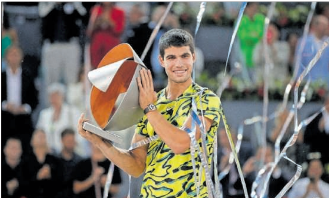
Carlos Alcaraz sostiene el trofeo de campeón del Mutua Madrid Open tras superar a Struff en la final.

Sin duda, los aficionados al tenis tienen una gran cita con el tenis femenino de primer nivel en el Club de Campo. Y, además, a partir del lunes 15 la entrada es libre.