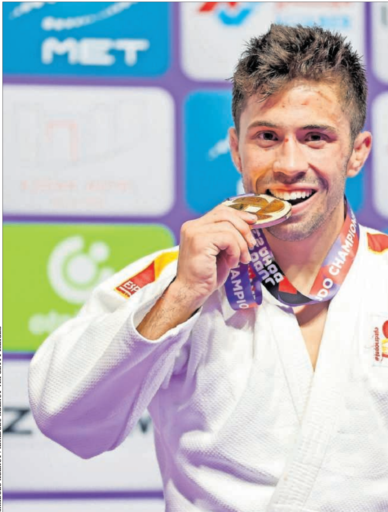
Fran Garrigós muerde la medalla de oro tras proclamarse campeón del mundo en los Mundiales de Doha (Qatar).