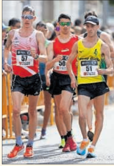
Momento del Gran Premio Marcha.

y participó en la entrega de premios a los ganadores, destacó que este tipo de competiciones internacionales "proyectan una atractiva visión de Madrid ante el mundo y convierten a la región en escaparate del deporte olímpico". El italiano Francesco Fortunato y la china Jiayu Yang, plusmarquista mundial de 20 km, reinaron en la Gran Vía.