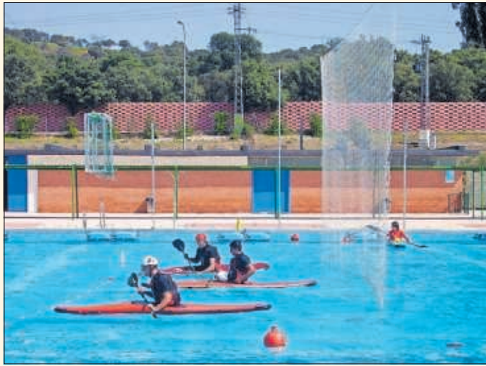
Actividad de piragüismo en la piscina de Puerta de Hierro.