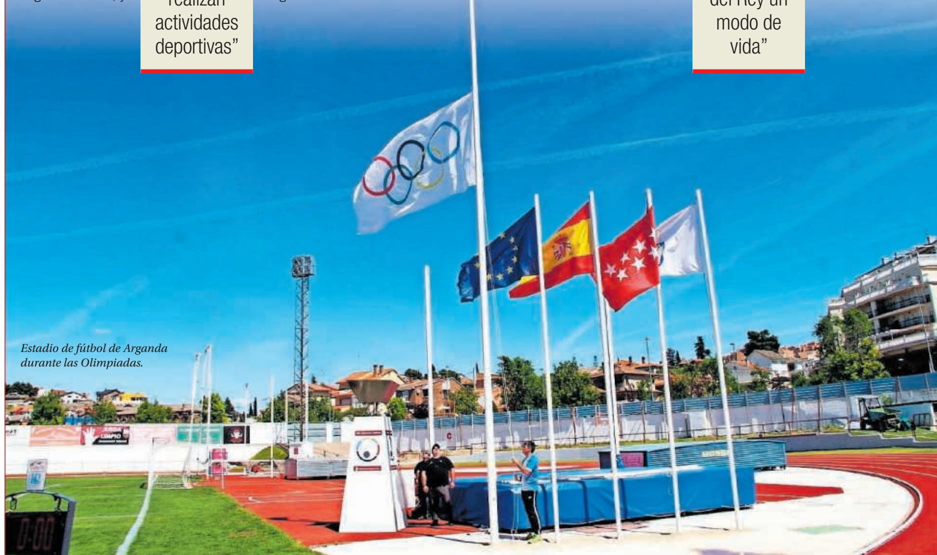
Estadio de fútbol de Arganda durante las Olimpiadas.