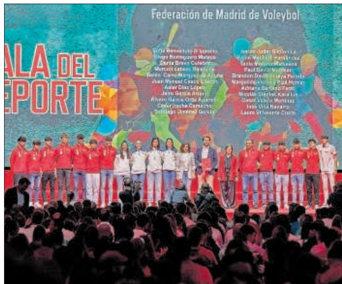
Momento de la Gala del Deporte de la Comunidad de Madrid.