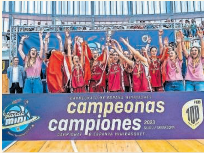
Las jugadoras madrileñas levantan el trofeo de campeonas.