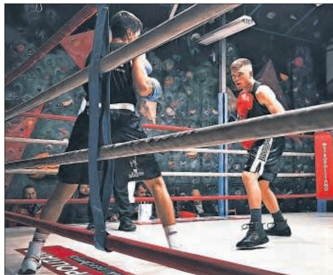
Dos boxeadores amateur pelean en las New Boxing Series.

Esta ley perpetuaba la estigmatización del boxeo, que cada vez es más practicado por jóvenes y adultos en los gimnasios de toda España. La reforma de la ley llega en el momento perfecto. Tres días más tarde, se celebrará el mayor evento de boxeo de la Comunidad Autónoma: la velada organizada y encabezada por Kerman Lejarraga (34-3-0, 26 KO), que contará con enfrentamientos entre los mejores púgiles nacionales el 29 de abril en el WiZink Center de Madrid, con capacidad para 14.000 personas y donde se disputarán dos Campeonatos de España. Esta fiesta del boxeo ya será para todos los públicos.