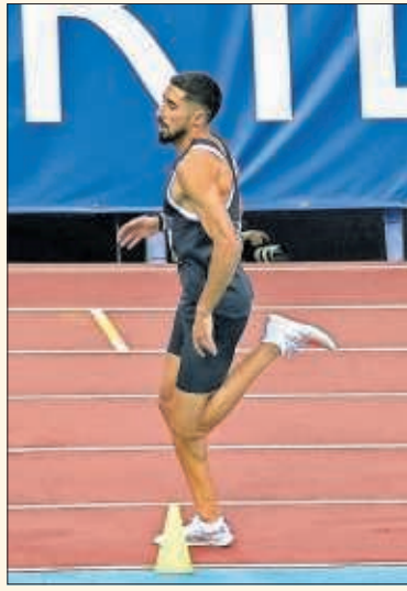
Un atleta corre en Gallur.

concreto, se realiza una revisión de los mínimos de participación en la competición exigidos, se crea una categoría intermedia entre la absoluta y las inferiores (segunda máxima categoría), se regula la equivalencia entre comunidades o se actualiza el texto considerando la aprobación de la profesionalización del fútbol femenino.