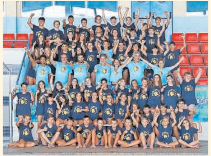
Los alumnos de una edición de MadPolo posan con sus monitores.