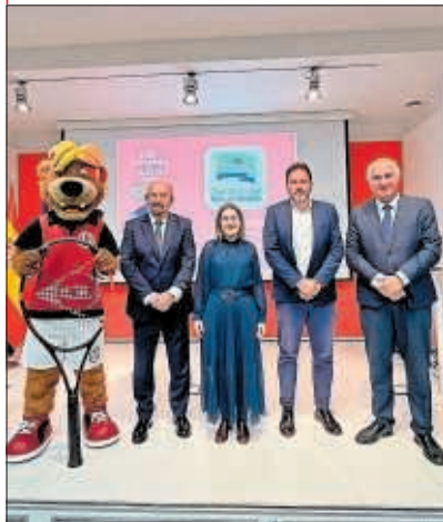
Presentación del Challenger.

Esta edición, que ya se ha acercado a los aficionados con la instalación de una pista en la Plaza de Colón (estará hasta el 5 de mayo), además, llega con novedades: se han ampliado los días de competición (de ocho a doce), los cuadros (de 96 jugadores) y se estrenará el Red Bull Bassline (25 de abril), un torneo revolucionario en formato tie-break. —A. SANCHO