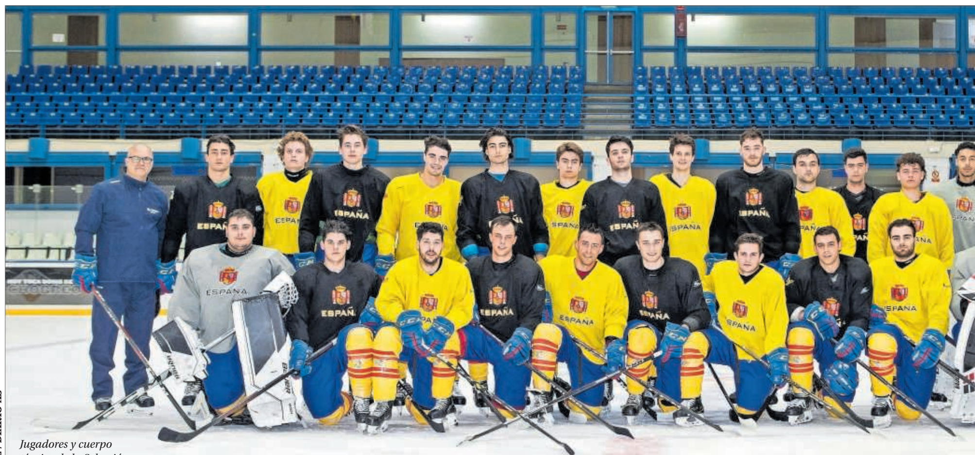
Jugadores y cuerpo técnico de la Selección española de hockey hielo posan para AS tras un entrenamiento.