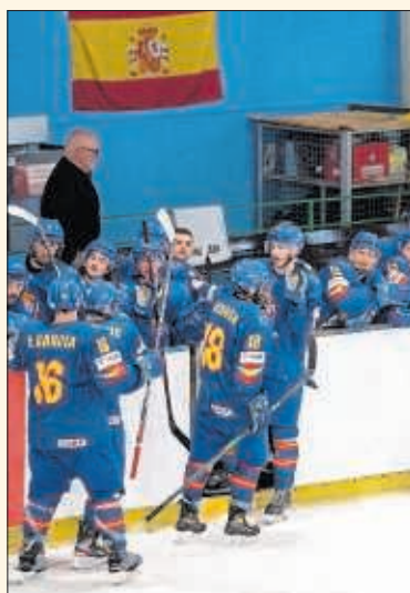
Partido de la Selección española.

fue en Granada 2018, competición en la que los pupilos del entrenador Luciano Basile lograron el oro y el ascenso a su categoría actual. En esta ocasión, deberán enfrentarse en la lucha por el título a Croacia, Australia, Islandia, Israel y Georgia, con el objetivo de acometer otro gran éxito internacional ante la afición española.