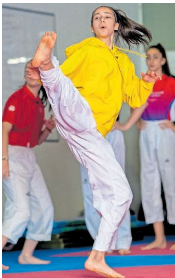
La taekwondista Adriana Cerezo, en un entrenamiento.

El Deporte Infantil de la Comunidad de Madrid cuenta con la competición igualitaria para dar acceso a la actividad deportiva a toda la población en edad escolar, independientemente del género o la capacidad deportiva. Todas las modalidades tienen una categoría abierta, contando con un total de 36 en las diferentes especialidades deportivas (18 en deportes colectivos y 18 en individuales). El fútbol es uno de los deportes en los que más se recurre a este sistema abierto. Además, se ha demostrado el desequilibrio de