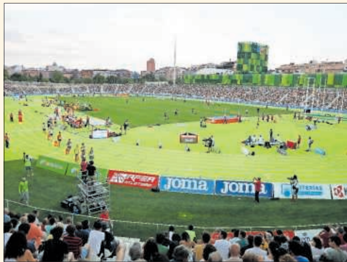
El Estadio de Vallehermoso acoge una competición.

la prestación 520 deportistas. Las ayudas se concederán en régimen de concurrencia competitiva y la cuantía a percibir por los beneficiarios será de un mínimo de 1.000 euros y de un máximo de 6.000, si se trata de carácter individual, o de 3.000, si se dedican a deportes de equipo, en función de los logros alcanzados en 2022.