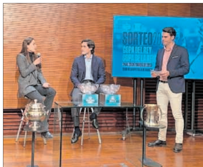
Celebración de los sorteos coperos en Madrid.