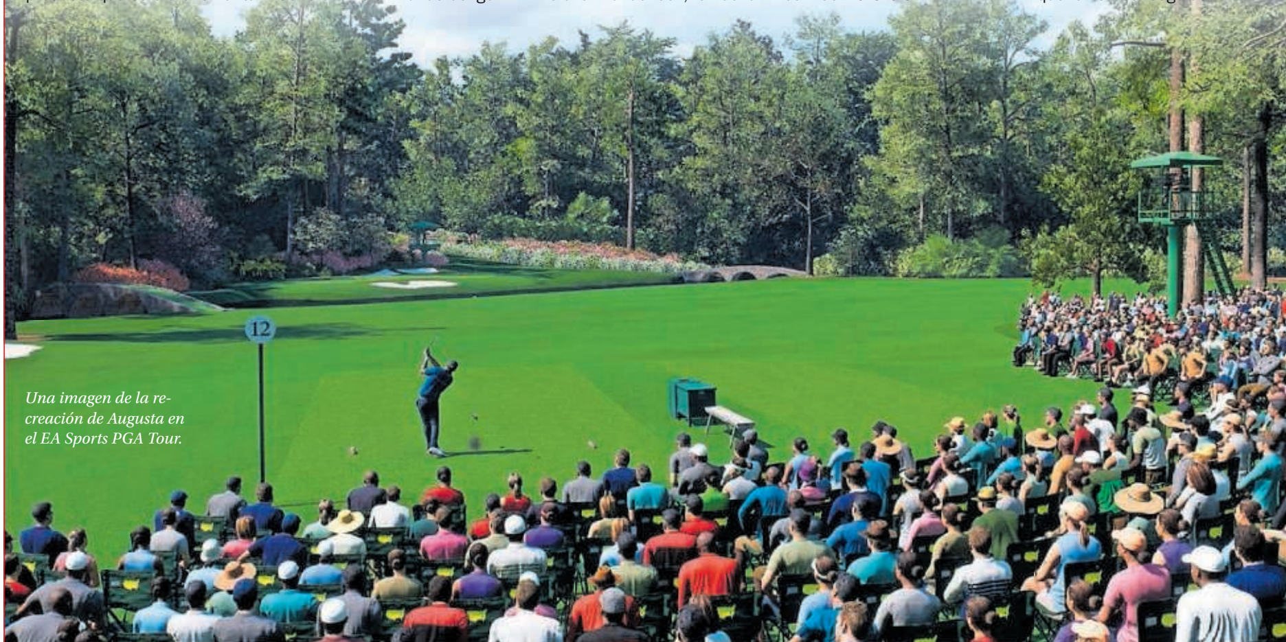
Una imagen de la recreación de Augusta en el EA Sports PGA Tour.

No se han quedado atrás en el realismo de la simulación. Habrá 20 tipos distintos de golpes y se incorporan tecnologías como shotlink y trackman , empleadas por el propio PGA. De lo que menos se sabe por ahora es del cartel de jugadores. Pero, además de nuevos campos, futuras actualizaciones incluirán, como se había apuntado y confirma Ruano, la Ryder Cup. Un bombazo. Si como dicen querían llevar "el prestigio de la competición del golf" a un juego, tiene toda la pinta de que lo han conseguido.