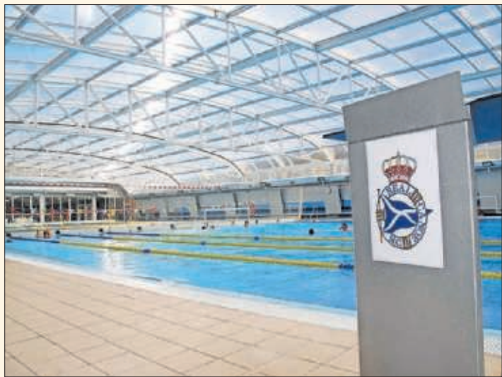
Instalaciones del Real Canoe Natación Club.