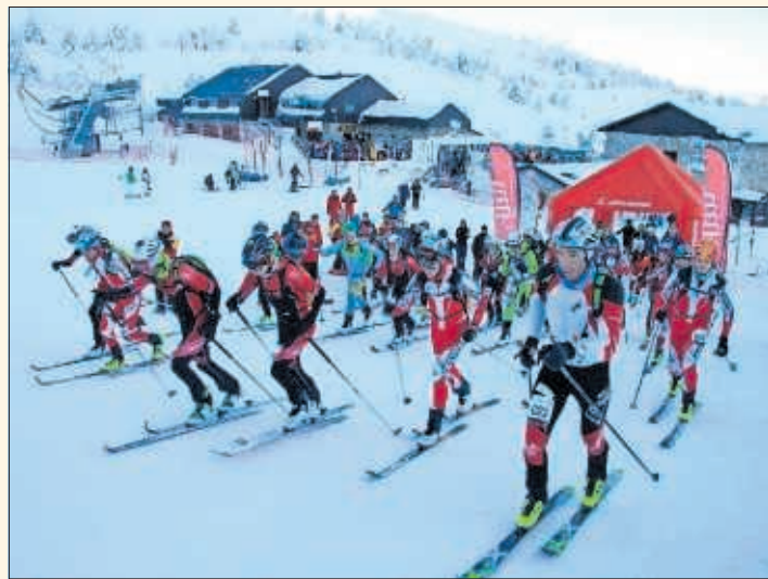
Participantes del pasado Gran Premio Atomic toman la salida.