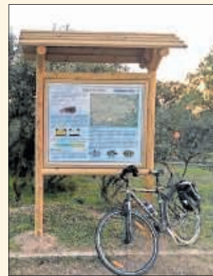
Circuito Enrique Otero.

El Circuito Enrique Otero vuelve a abrir sus puertas