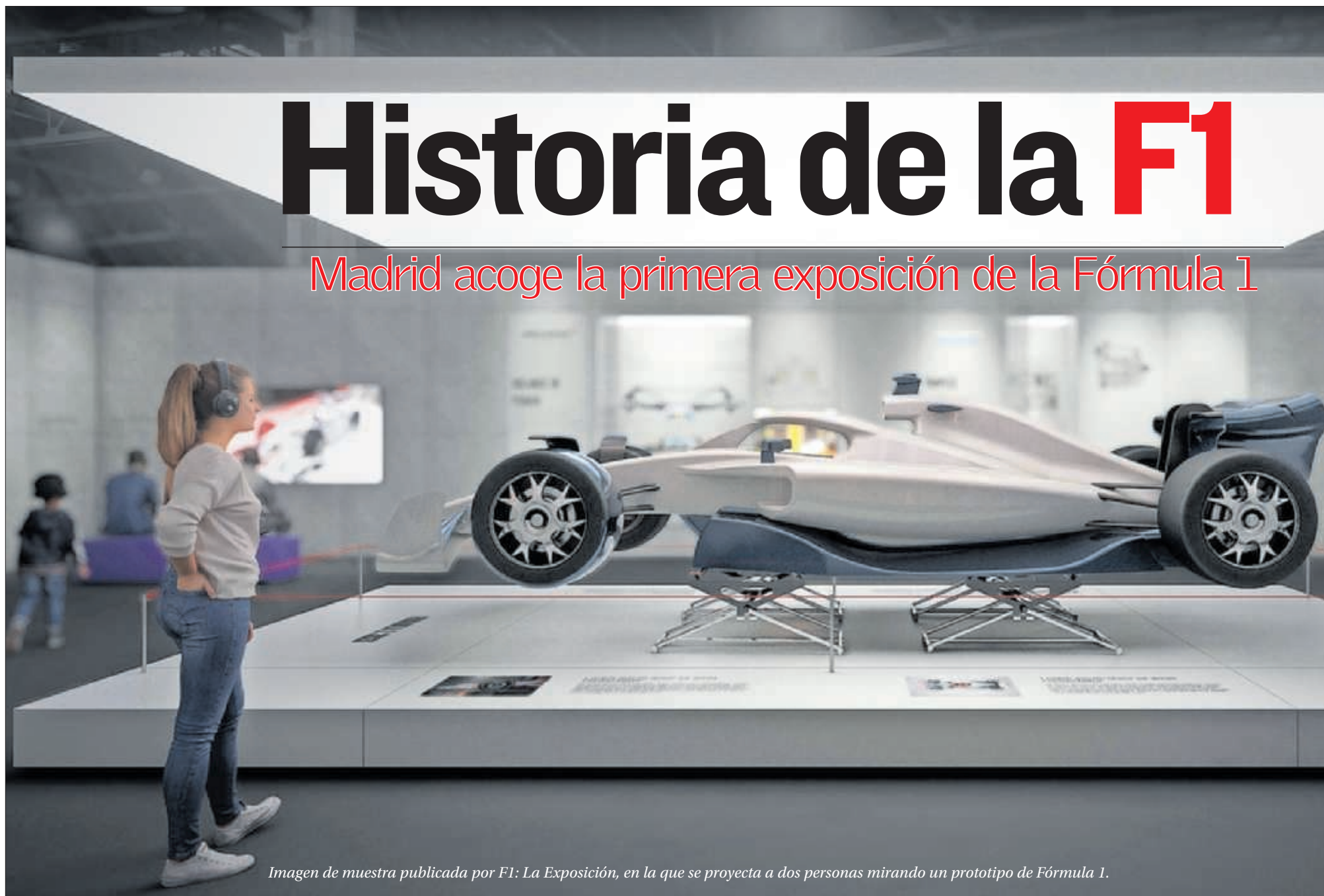
Imagen de muestra publicada por F1: La Exposición, en la que se proyecta a dos personas mirando un prototipo de Fórmula 1.

Madrid acoge la primera exposición de la Fórmula 1