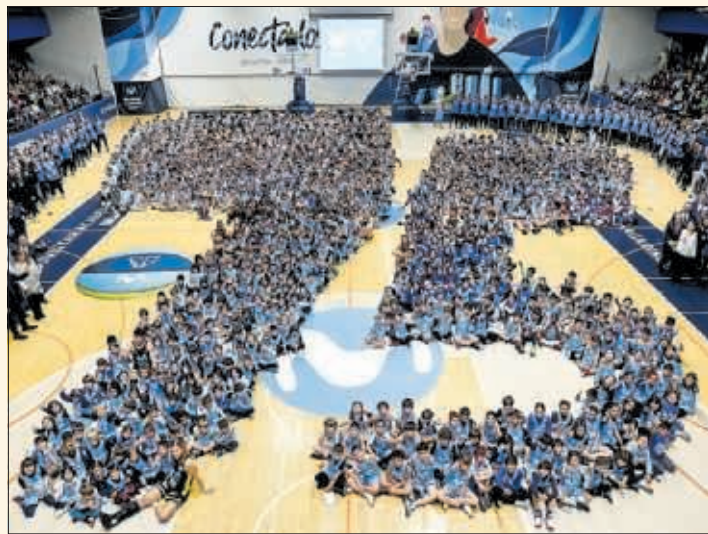
Foto de familia de la cantera del Movistar Estudiantes en el Magariños.