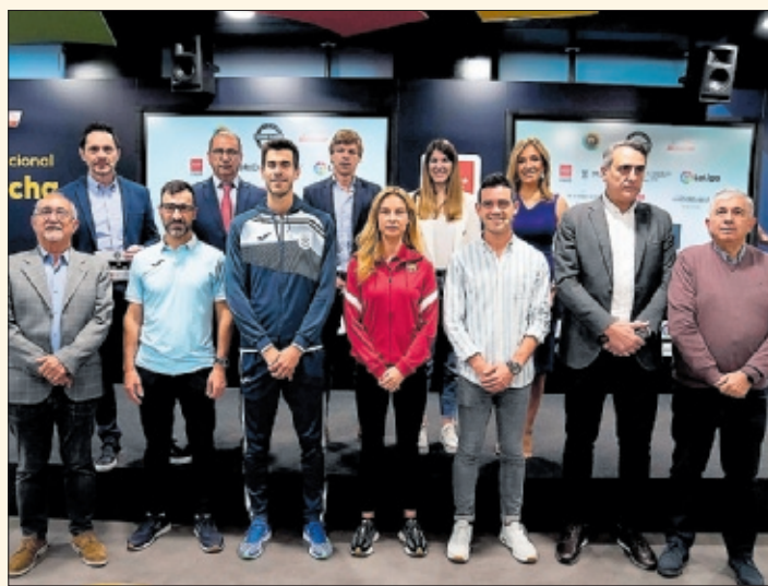
Participantes de la presentación de la prueba en la sede de LaLiga.