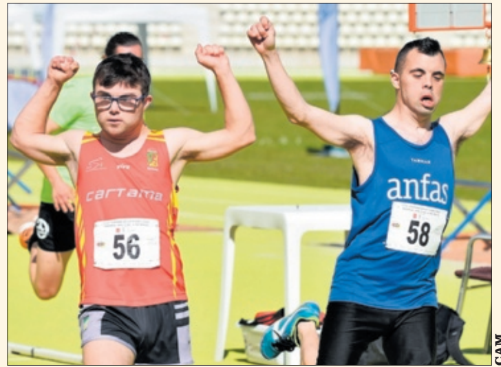
Dos atletas celebran tras su llegada a meta en Vallehermoso.

La Comunidad de Madrid apoyó este evento con un patrocinio de 12.000 euros, que se suman a los 83.819 que han recibido las agrupaciones de deportistas con discapacidad intelectual en 2022.