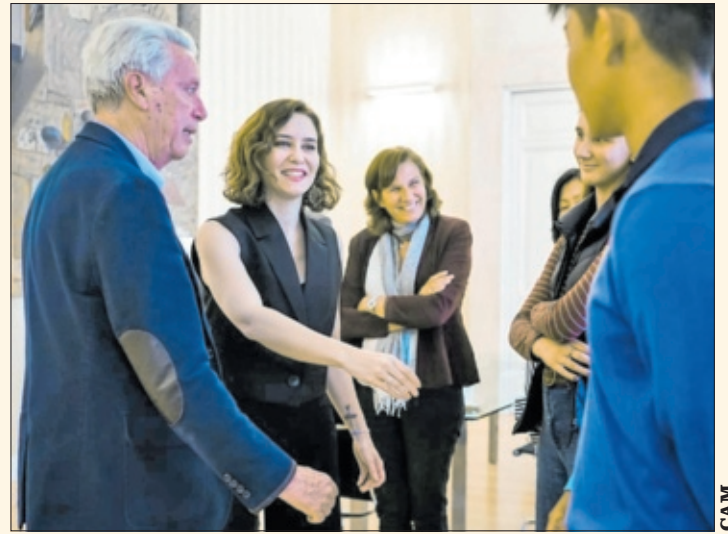
Isabel Díaz Ayuso saluda durante la entrega de la Medalla al Mérito.

la presidenta destacó el “honor” que supone recibir este reconocimiento de “la segunda federación con más deportistas federados de la región” y un deporte “que forma en valores, esfuerzo y destreza. Que no entiende de clases sociales, por muy estigmatizado que hayan intentado situarlo, y mucho menos de edades”.