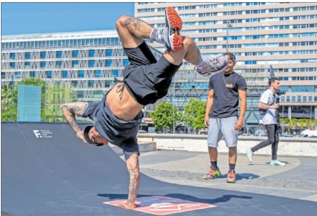
Un b-boy realiza una exhibición durante la presentación del Madrid Urban Sports en la Plaza de Colón.

Televisión Siete finales del evento serán emitidas en directo por Teledeporte