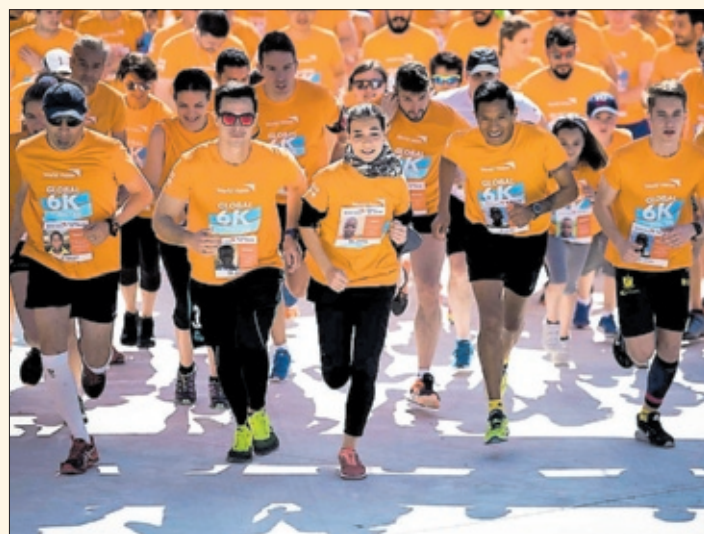
Varios corredores, durante la última edición de la Global 6K for Water.

Además, quien lo desee puede realizar un donativo para las causas del proyecto también desde la web de la prueba.