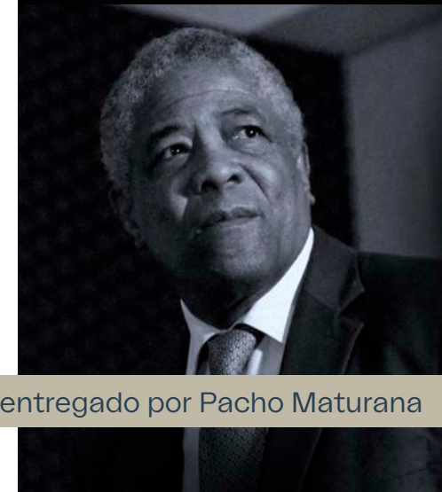
Premio entregado por Pacho Maturana