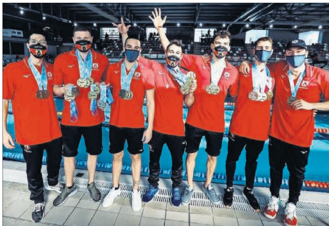
Los nadadores del CN Madrid que compitieron en el Nacional de Castellón y lograron 15 medallas.