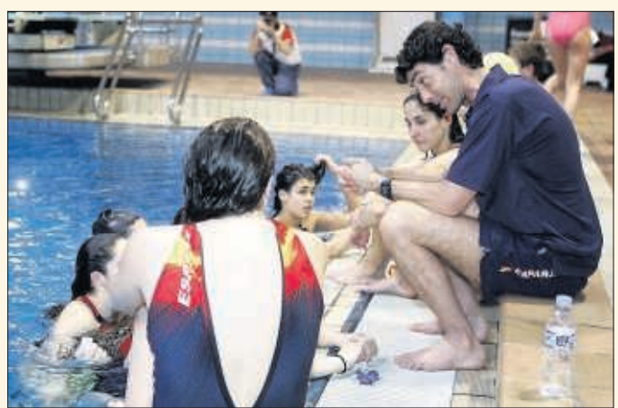
Oca de explicaciones a sus jugadoras en un descanso.