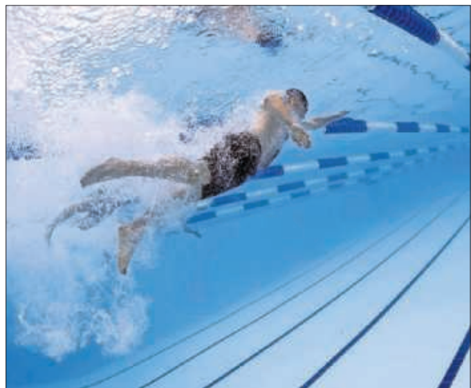
Un nadador se ejercita en un centro deportivo de la Comunidad.

Aire libre. Por otro lado, la Comunidad destinará 3,6 millones de euros a fomentar el ejercicio al aire libre. El dinero se invertirá en la creación de espacios abiertos en los que se puedan desarrollar programas que incidan en la salud y la calidad de vida de sus participantes, así como a la adquisición de material para valorar la condición física de los usuarios. Estos enclaves se llamarán 'Puntos Activos de Ejercicio Físico' y podrán estar en cualquier municipio de la región. Se subvencionarán proyectos realizados a lo largo de todo 2021. La bonificación será del 100% hasta 150.000 euros.