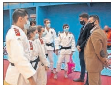
Momento de la exhibición.

López, que cuenta 27 años y es titulada en Psicología, tertia que lo conseguido en República Checa “fue una pasada”. “Me costó un poco empezar, en el primer combate no me sentí muy bien. Pero luego fui entrando en la competición. Estoy flipando aún”, añade incrédula. Cuenta que el confinamiento le pilló en Almería. Por suerte, en un piso con terraza, espacio útil para entrenar. Cree que el aspecto mental fue clave: “Puse mucha cabeza, haciendo trabajo psicológico todas las semanas. En algún momento se hizo duro”. Para ella unos Juegos en 2021 suponen “más oportunidades” para conseguir ganarse una plaza. Aguantar el tipo ha merecido la pena.