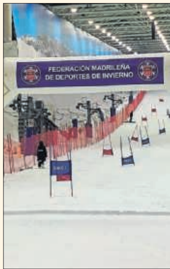
La pista de SnowZone.

y sub-16. El éxito de participación fue total, con 230 deportistas compitiendo en las modalidades de slalom y mini-gs. En la misma semana, la FMDI presentó en la sede de la Universidad Europea de Madrid, en Alcobendas, su nueva App, que "permitirá a deportistas, clubes, técnicos y seguidores" estar al tanto de actividades, ofertas y descuentos.