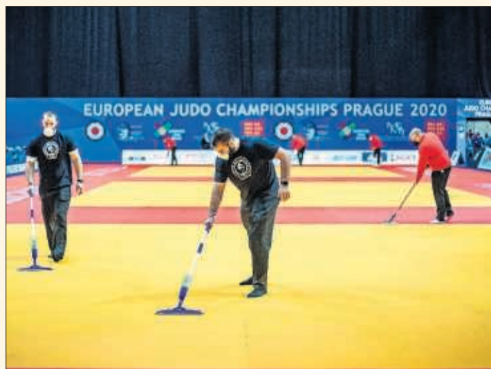
Operarios hacen labores de limpieza durante el último Europeo.