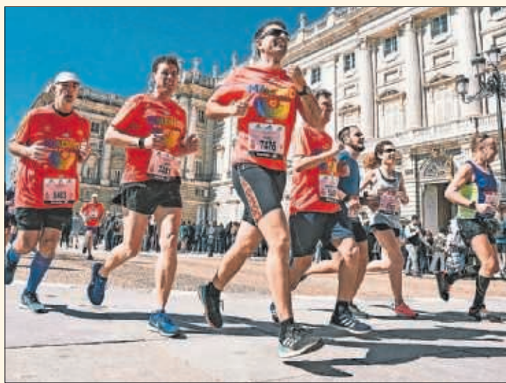
La EDP Madrid Maratón, a su paso por el Palacio Real.

la organización avisa de que los dorsales disponibles son muy limitados y apremia a los que quieran tomar parte a realizar la gestión cuanto antes. La inscripción se puede hacer en la web www.edprocknrollmadrid.com . A partir de ahí solo queda esperar para volver a vivir una cita que llena de vida las calles de Madrid.