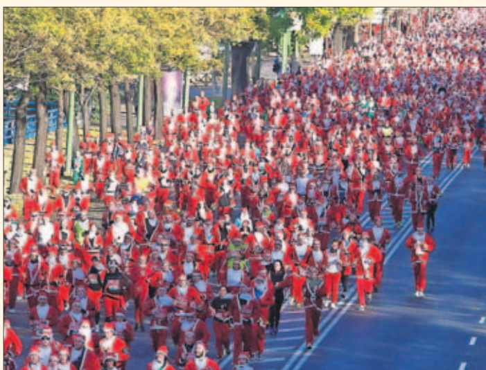
MAREA. Cerca de 10.000 atletas vestidos de Papá Noel en Madrid.

cuentan desde la organización de esta prueba, la más numerosa con atletas ataviados con la ropa de Papá Noel del mundo, que está patrocinada por El Corte Inglés. Los más pequeños (menores de 12 años) también podrán disfrutar de la fiesta en la categoría elfo, con su correspondiente traje. Una gran carrera para ir calentando la Navidad.