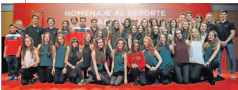
BAJO EL FRÍO. La Federación de Deportes de Hielo.