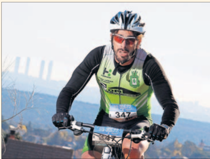
BROCHE. El Du Cross de Torrelodones puso cierre a la temporada.

en 2015 un total de 10 pruebas que han congregado a cerca de 5.000 participantes y en las que se han recorrido 227,8 kilómetros a lo largo y ancho de la Comunidad de Madrid. Du Cross Series ya está preparando una gran fiesta final, con fecha y lugar aún por determinar, a la que estarán invitados todos los participantes de la temporada. — J. Á. ORIHUELA