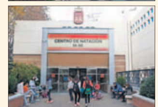
TECNIFICACIÓN. El Ortega y Gasset y las piscinas M-86.