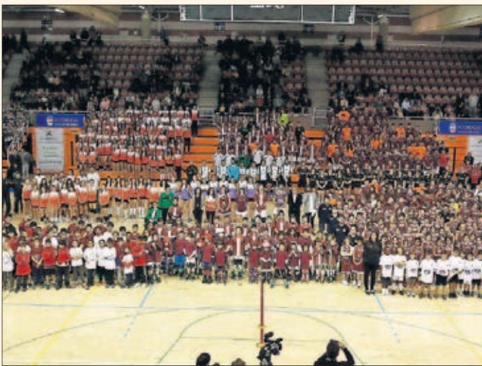
LA PRESENTACIÓN DE FUNDAL. Una foto de familia polideportiva.