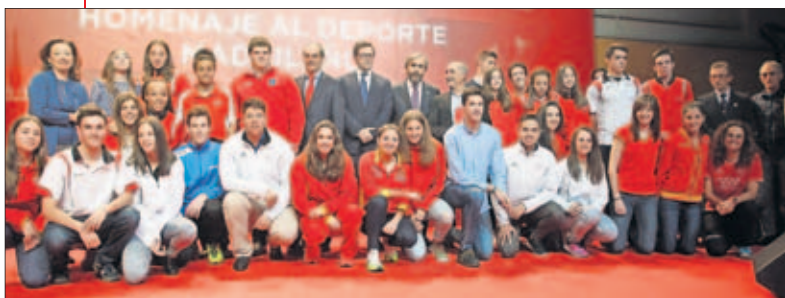
VELOCES. La Federación Madrileña de atletismo.