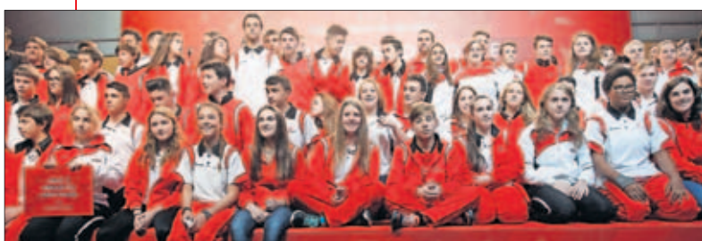
LLAVE. La Federación Madrileña de Judo fue muy numerosa.