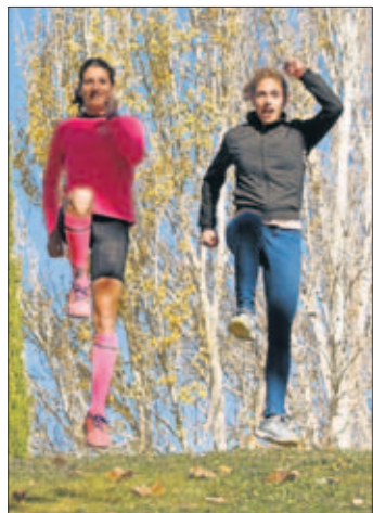
Saltando en la Blume.

Ambas tienen muchas cosas en común. Son de Madrid y compiten en 3.000 obstáculos (donde Diana es bronce europeo), aunque Elena corría en 1.500 hasta hace un año. “La preparación para los obstáculos me ha hecho hacer más volu-